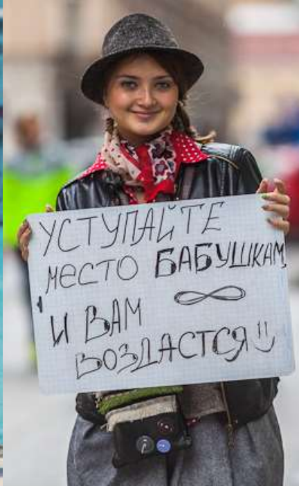
ПИТЕРЦЫ И МОСКВИЧИ