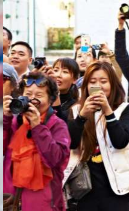
ИНОСТРАННЫЕ ТУРИСТЫ ПИТЕРА